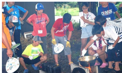
四谷小との交歓会 火起こし奮闘の野外炊飯

保護者、地区の皆様、子どもたちの安全な夏休みへのご協力、本当にありがとうございました。プール当番や23日のPTA作業につきましても重ねて御礼申し上げます。