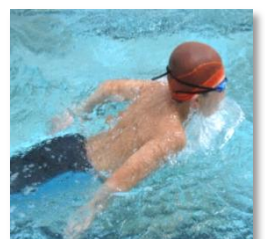
自己ベスト目指しての力泳