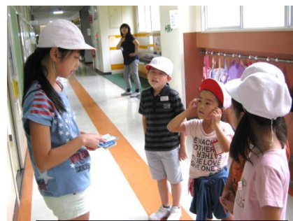
縦割り班での掃除の反省会

パラリンピックは応援するけれど、一番身近な自分の学校の友達の違いには不寛容な態度を見せるという悲しいことがないように、思いやりの心を育む教育をすすめています。どうぞ、保護者・地区の皆様、子どもたちが共生社会をたくましく生きていく力をつけるためにも、正しい人権意識が育ちますように、どの子どもにも温かい目をかけていただけますようよろしくお願いいたします。