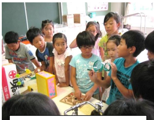
夏休みの工作を友達に紹介する3年生