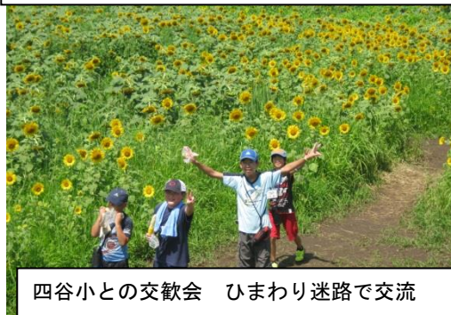
四谷小との交歓会 ひまわり迷路で交流