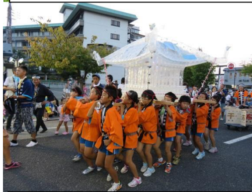
4年生、念願叶って将棋御輿パレードへ